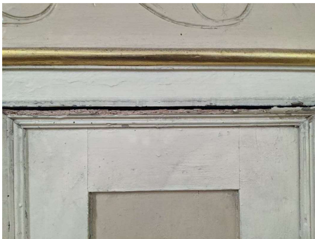
Fot. nr 4 XIX wieczny prospekt organowy i balustrada chóru muzycznego z kościoła p.w. Narodzenia Najświętszej Marii Panny w Mińsku Mazowieckim. Widok zniszczeń struktury drewna spowodowane obecnością insektów.

Parafia Rzymsko-Katolicka p.w. Narodzenia NMP ul. Kościelna 1 05-300 Mińsk Mazowiecki NIP 822-147-28-59, Regon 040092548 tel. 25-758-25-38